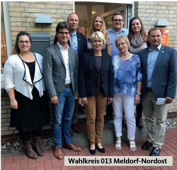
Wahlkreis 013 Meldorf-Nordost