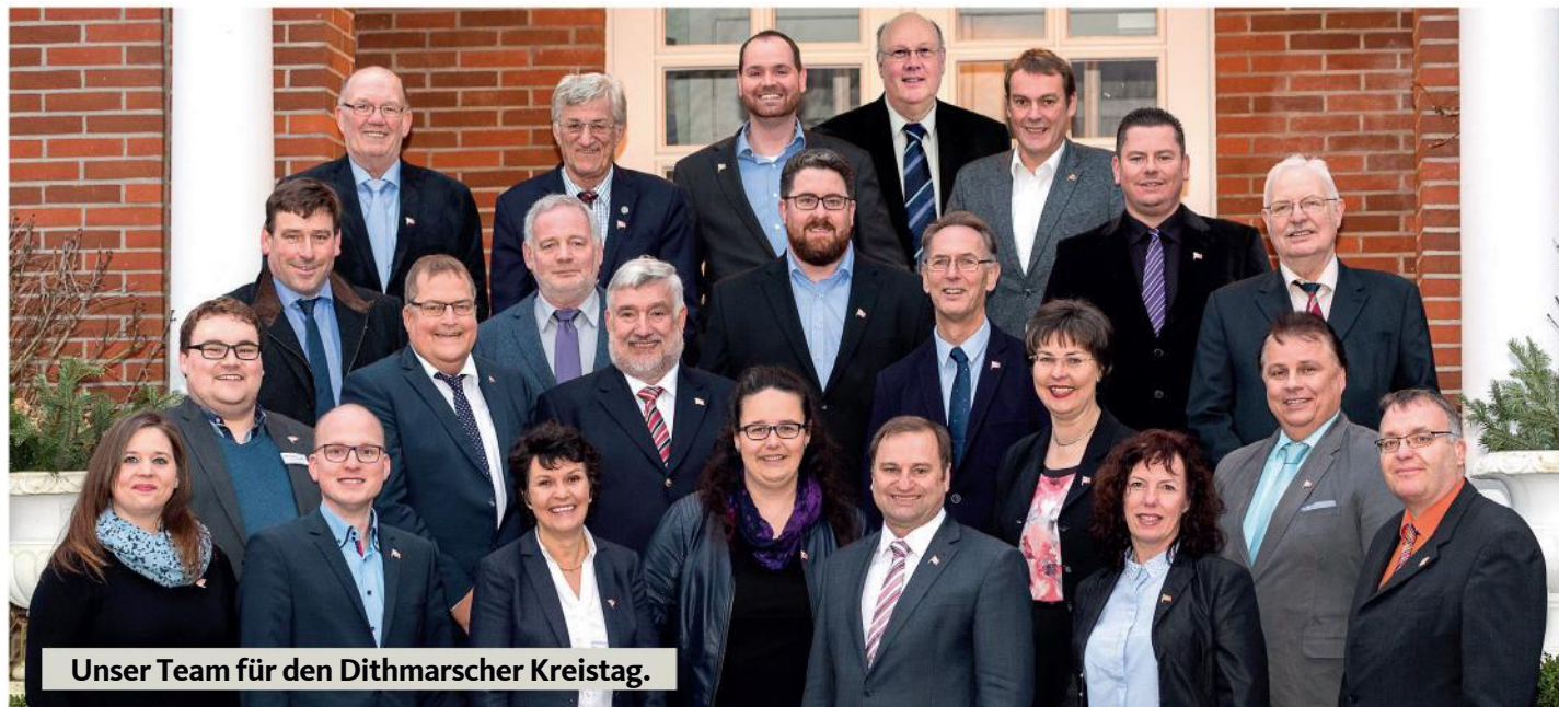
Unser Team für den Dithmarscher Kreistag.

Zu einer guten Infrastruktur zählen für uns nicht nur intakte Straßen und Radwege, sondern auch der zügige Breitbandausbau für schnelles Internet. All dies macht nicht nur das Leben angenehmer, sondern ist Grundvoraussetzung für gutes Wirtschaften.